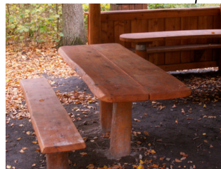
Bord & bænke